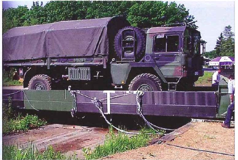
Рис. 2. Пример зарубежного военного инвентарного моста

среды конструкции из ПКМ не нуждаются в складском обслуживании. Конструкции из ПКМ обладают, как правило, меньшим весом, что снижает расходы на транспортные, погрузочно-разгрузочные и монтажные работы. Кроме того, это ведет к существенному уменьшению сроков монтажа, что часто является критическим показателем проекта.