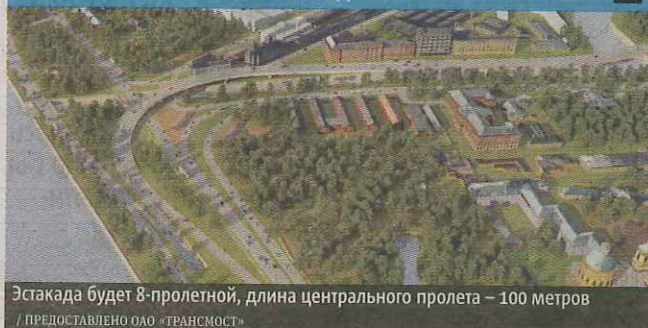
Эстакада будет 8-пролетной, длина центрального пролета – 100 метров

Скачай приложение PointCloud на apps.metronews.ru